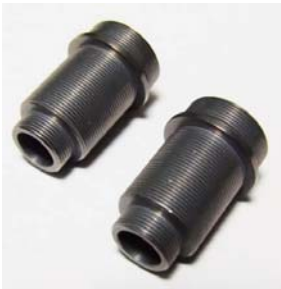
ダンパーシリンダー