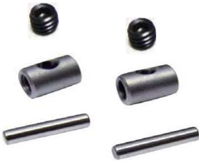
WPCクロススパイダー

標準品のクロススパイダーと比べて摩擦抵抗が少ない為、抜群の転がりを実現 ピン径2ミリ・長さ9.8ミリのTOPLINE製やドリパケ用のユニバーサルにも使用可