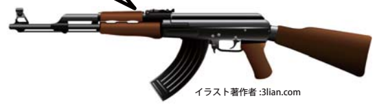
イラスト著作権者:3lian.com