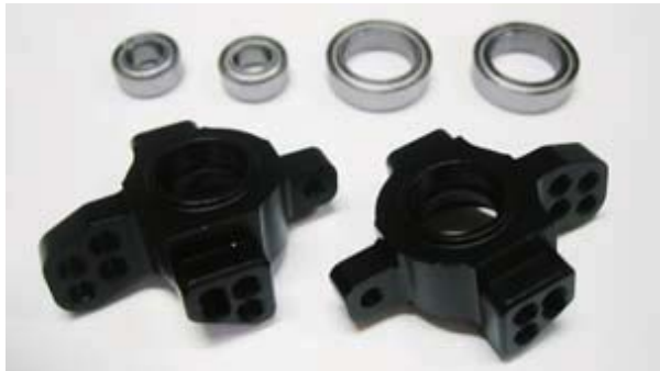
ベアリングは付属します(1050、1510 各2個)